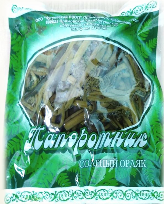
Финансовый вложения в проект ООО "Чугуевский Райзаготовхотпром Приморского крайпотребсоюза"